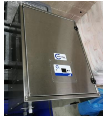
Generador de Ozono