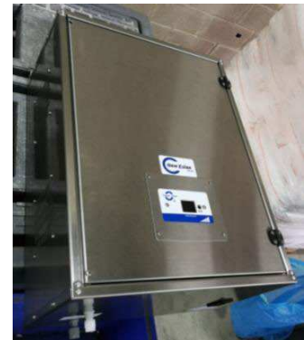
Generador de Ozono